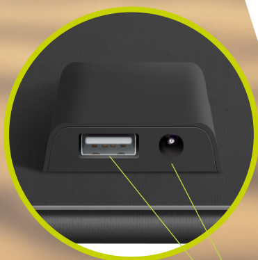
Port DC jack 2,1 x 5,5mm Port USB type A