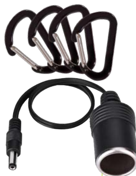
Livré avec 4 mousquetons + 1 câble jack DC / allume-cigare